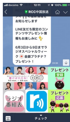
■RCC公式LINEアカウントからプレゼント応募