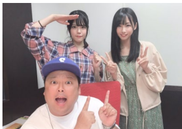
■STU48のちりめんパーティーメンバー投票！SHOWROOMでも同時配信(約5000人が視聴)