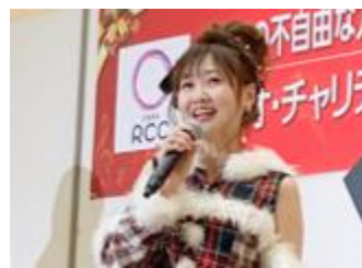
■ 24日はゆめタウン広島会場 メンバー、パーパー、Mebius、Dressing 左から)らの歌とお笑いステージ