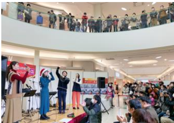
■ 楽しみにしていた観覧者は3Fにも (ゆめタウン広島)